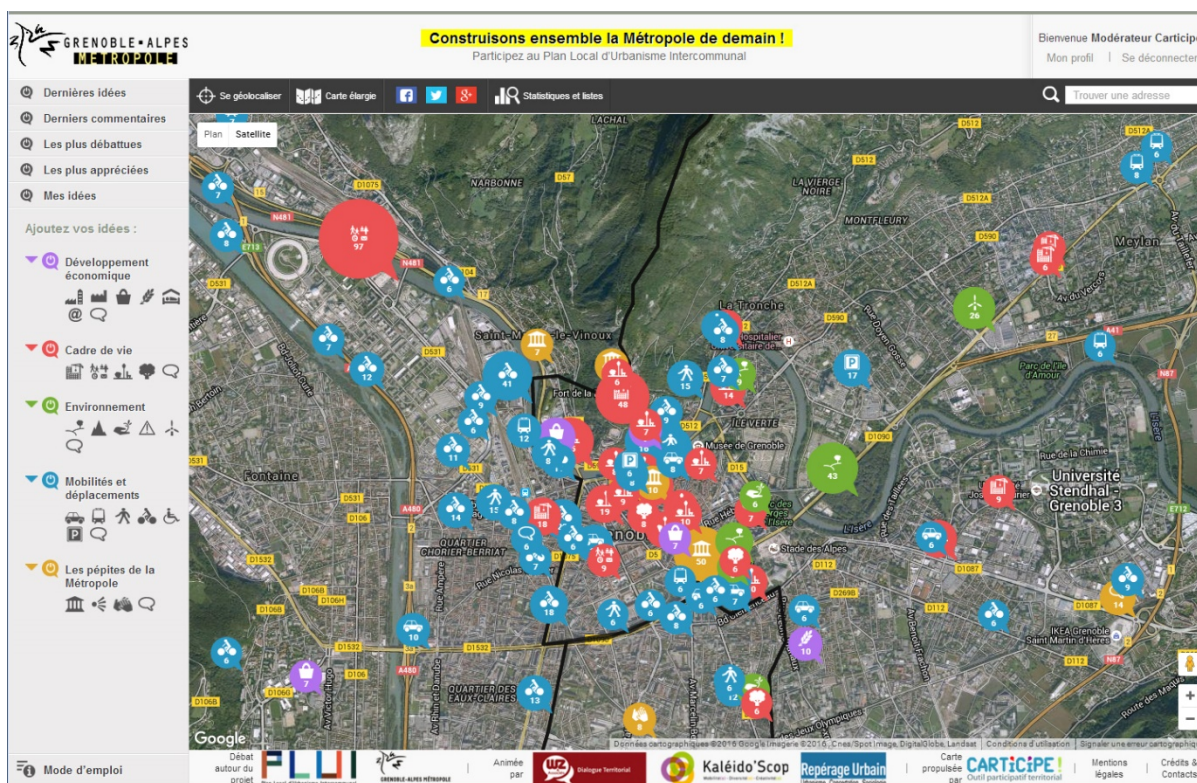
Exemple d'usage de CartiCipe à Grenoble

Pour ne donner qu'un exemple de démarche ayant adopté l'outil CartiCipe, nous pouvons citer l'un des projets retenus dans le cadre de l'appel à projet de préfiguration des conseils de citoyens interquartiers intitulé « Du quartier à la métropole, co-produire un cadre pour l'action locale dans le Grand Paris », lancé en 2015 par de l'association Métropop'. Le projet en question visait ainsi à « concevoir avec les habitants une approche métropolitaine interquartier de capacitation citoyenne » sur cinq territoires d'Ile de France (dont 4 quartiers prioritaires) 23 .